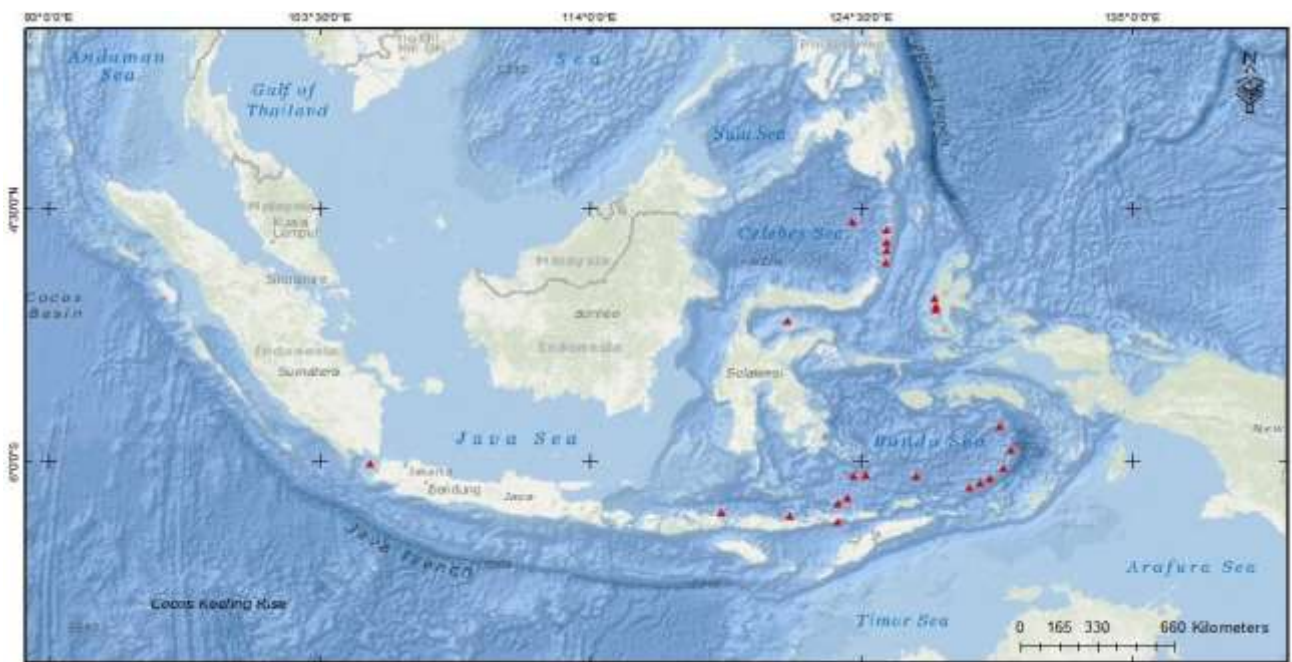
Red Triangle is Major Volcanoes of Indonesia with eruptions since 1900 A.D.