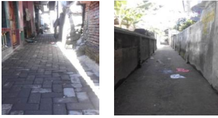
Gambar 2. Kondisi Fisik Lingkungan di Kelurahan Karang Pule

yang ada sebagian besar sudah menggunakan beton, namun ada beberapa jalan yang masih merupakan jalan setapak.