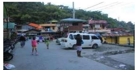
Gambar 1. Kondisi Pemukiman

Kondisi eksisting di Kelurahan Bhayangkara menurut beberapa warga yang sudah bermukim hampir 20 tahun terbentuknya permukiman di Kelurahan Bhayangkara ini akibat harga tanah yg murah dan dekat dengan pusat kota dan perdagangan dan jasa. Hal tersebut yang menjadi alasan mengapa masyarakat membeli tanah dan bermukim disana sedangkan berdasarkan arahan tata ruang wilayah Kelurahan Bhayangkara sudah di peruntukkan sebagai hutan konservasi.