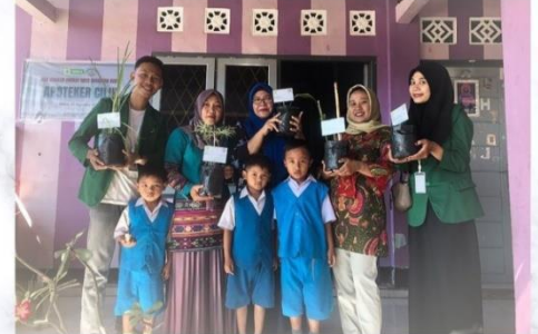
Penyerahan tanaman obat keluarga (TOGA) ke TK PKK Desa Teros program kerja inti dari prodi Farmasi Senin, 12 September 2022 @kkndesateros.klmpk52_