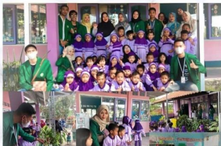
Apoteker Cilik dan pembagian vitamin gratis di TK PKK Desa Teros [ Program kerja dari prodi Farmasi ] Rabu, 31 Agustus 2022 @kkndesateros.klmpk52_