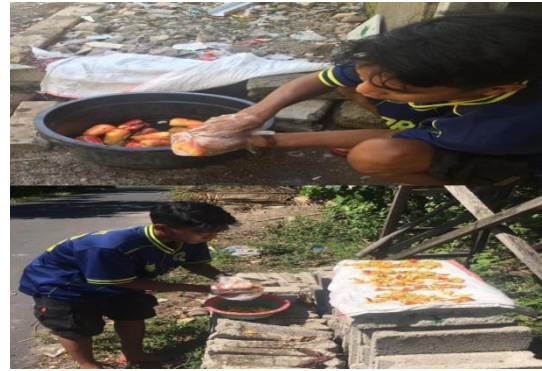
Gambar 2. Proses Pembersihan Bahan Baku (Daging Jambu Mete)

Kegiatan dilaksanakan di posko Desa Batu Rakit, Kecamatan Bayan. Kegiatan pengolahan daging jambu mete menjadi abon dimulai dengan penyuluhan, persiapan bahan dan peralatan yang diperlukan dan dilanjutkan dengan kegiatan pelatihan pembuatan abon dari daging jambu mete. Berikut dokumentasi pelaksanaan kegiatan yang disajikan pada gambar dibawah ini.