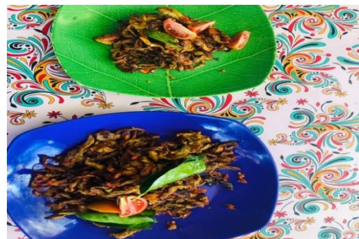
Gambar 3. Hasil Pengolahan Daging Jambu Mete Menjadi Abon

Dalam kegiatan pengabdian ini, peserta diberikan edukasi terkait bagaimana cara memanfaatkan potensi-potensi yang ada disekitar tempat tinggal menjadi barang atau bahan yang memiliki nilai ekonomis. Selain itu peserta juga diberikan keterampilan bagaimana cara mengolah daging jambu mete menjadi bahan pembuatan abon. Peserta juga sadar bahwa daging jambu mete dapat diolah dengan baik dapat meningkatkan nilai dari daging jambu mete dan meningkatkan perekonomian masyarakat setempat.