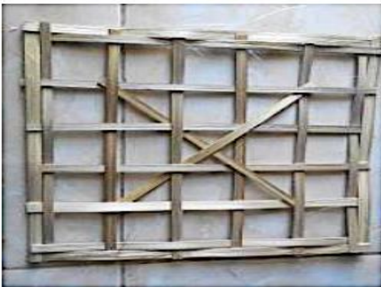
Gambar 1 Klakat Agung

Klakat Agung berbentuk persegi empat memiliki pemepet dan memiliki tanda silang yang berada di tengah Klakat yang berfungsi menopang bebantenan agar tidak jatuh biasanya di gunakan untuk Upacara Besar Agama Hindu seperti Odalan, Melasti, Melaspas, dan Yadnya.