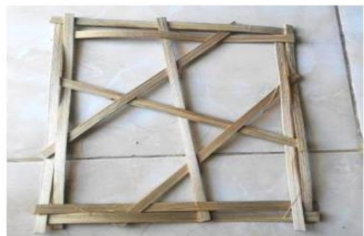
Gambar 2 Klakat Sudhamala Lanang