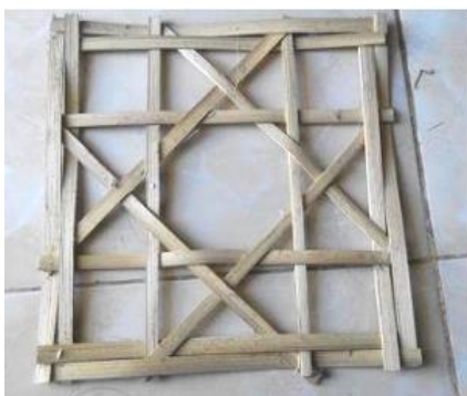
Gambar 3 Klakat Sudhamala Istri

Sama seperti proses pembuatan Klakat Sudhamala Lanang di atas, Klakat Sudhamala Istri memiliki bahan dasar dari Batang bambu yang telah dipotong dan dipecah sehingga berbentuk seperti batang pipih seperti gambar di atas. Untuk lebih jelasnya, proses dan tata cara pembuatannya Klakat Sudhamala Istri dapat dipaparkan sebagai berikut. Berikut langkah-langkah pembuatannya :