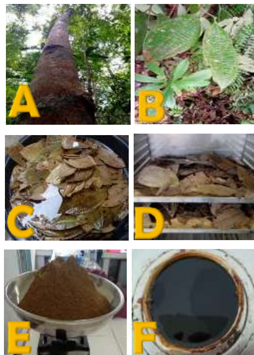
Gambar 1. Pohon Sintok Lancang (A), Daun Sintok Lancang segar (B), Proses pencucian daun (C), Proses pengeringan daun menggunakan oven (D), Serbuk daun Sintok Lancang (E), Proses pengentalan ekstrak daun Sintok Lancang (F)

sehingga sangat perlu untuk dilakukan pengujian lanjutan untuk melihat pengaruh penambahan konsentrasi ekstrak daun Sintok Lancang. Selain itu berdasarkan uji antioksidan sebelumnya daun Sintok Lancang berpotensi mempunyai daya antioksidan kuat ( IC_{50} DPPH= 26.99 \pm 0.27 ppm dan nilai uji FRAP= 779.73 \pm 19.66 \mu mol trolox/g) (Ardhany et al , 2021), penelitian lainnya dengan menggunakan batang Sintok Lancang juga menghasilkan antioksidan yang kuat ( IC_{50} DPPH= 20.63 \pm 0.82 ppm dan nilai uji FRAP= 968.38 \pm 22.25 \mu mol trolox/g) namun aktivitas antibakteri yang juga lemah ( 3.17 \pm 0.90 - 8.90 \pm 1.50 mm) (Novaryatiin et al , 2023).