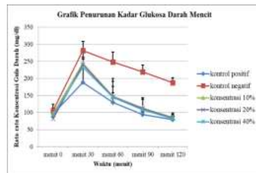
Gambar I. Grafik Penurunan Glukosa Darah Mencit (mg/dl)

mencit secara oral telah berhasil menaikkan kadar glukosa darah mencit. Hasil yang didapatkan dari penginduksian glukosa ini yaitu kadar glukosa darah melebihi atau sama dengan 126 mg/dL (kadar glukosa darah puasa) yang dianggap telah diabetes (Soemardji, 2004). Pengukuran kadar glukosa darah pada mencit dilakukan selama 2 jam, dimulai setelah mencit diinduksi glukosa secara oral pada menit ke 30, 60, 90 dan 120. Hal ini bertujuan untuk mengetahui dan melihat pengaruh waktu terhadap penurunan kadar glukosa darah mencit. Hasil Pengukuran dapat dilihat pada Gambar I.