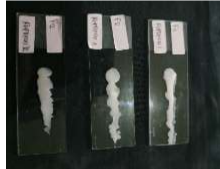
Gambar 3. Hasil uji homogenitas sediaan lilin aromaterapi minyak atsiri jahe merah dan minyak atsiri batang medang

dipastikan bahwa pencampuran yang dilakukan homogen.