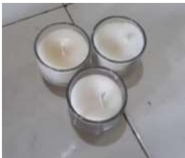
Gambar 2. Lilin aromaterapi kombinasi minyak atsiri jahe merah ( Zingiber officinale var. Rubrum ) dan

Formulasi lilin aromaterapi minyak atsiri jahe merah ( Zingiber officinale var. Rubrum ) dan minyak atsiri batang medang ( Cinnamomum iners Reinw. ex Blume) dibuat dengan variasi konsentrasi dari kombinasi minyak atsiri jahe merah dan batang medang (16% : 2%), (11% : 7%), (4% : 14%) dan dilakukan dengan metode peleburan. Minyak atsiri tidak dipanaskan hal ini untuk mencegah rusaknya zat yang berkhasiat karena minyak atsiri mudah menguap.