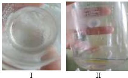
Gambar 1. Minyak atsiri jahe merah ( Zingiber officinale var. Rubrum ) (I) dan minyak atsiri batang medang ( Cinnamomum iners Reinw. ex Blume) (II)

Pemeriksaan karakteristik minyak atsiri bertujuan untuk mengevaluasi kualitas mutu dari minyak atsiri yang dihasilkan meliputi uji organoleptis, rendemen, bobot jenis dan kelarutan dalam alkohol 70%. Mutu pada minyak atsiri ditentukan dari sifat fisika-kimia minyak, umur tanaman, jenis tanaman, perlakuan bahan sebelum penyulingan, peralatan penyulingan yang digunakan, proses penyulingan, perlakuan minyak setelah penyulingan, pengemasan, dan penyimpanannya (Khasanah et al , 2015).