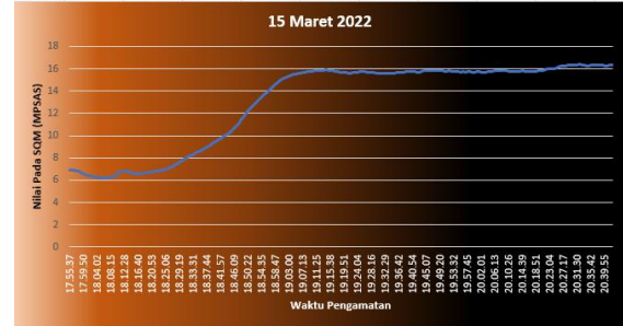
Gambar 1. Grafik SQM tanggal 15 Maret 2022 dari jam 17.55 – 20.40 WIB

Data yang diterima dari SQM diperiksa kembali tampilan datanya dengan melakukan menyajikan dalam bentuk grafik seperti yang ditunjukkan pada gambar 1. Data diolah dari dasar pembacaan SQM saat menerima pembacaan data saat langit mulai berubah menjadi semakin gelap. Untuk memudahkan pembacaan grafik, pengolahan data dibatasi hingga pukul 20.40 sehingga tampilan grafik dan pembacaan analisis metode Moving Average lebih presisi pada awal waktu perubahannya.