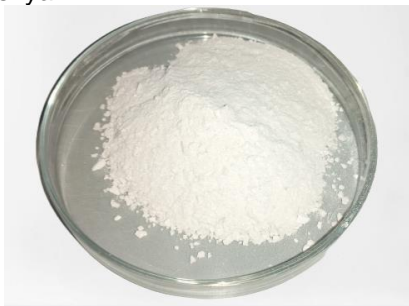
Gambar 1. Serbuk Kitosan dari cangkang kerang mutiara ( Pinctada maxima )

Kitosan telah berhasil diisolasi dari cangkang kerang Mutiara (gambar 1). Adapun dalam setiap tahapan isolasi terjadi pengurangan massa sampel di setiap prosesnya.