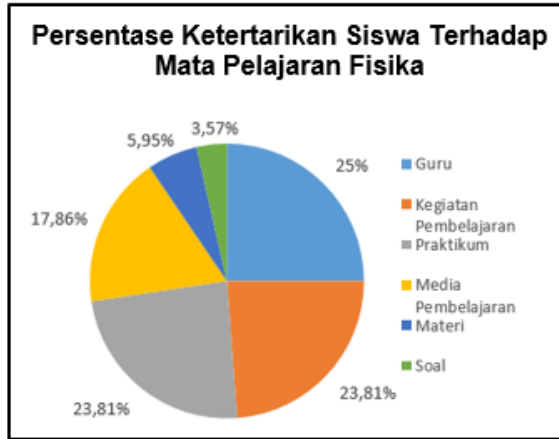
Gambar 1. Persentase ketertarikan siswa terhadap mata pelajaran fisika

menganggap tidak. Alasan yang dikemukakan siswa mengenai ketertarikan mereka pada mata pelajaran ini cukup beragam, diantaranya karena kegiatan pembelajaran, guru, praktikum, media pembelajaran, materi, dan soal. Berikut adalah persentase alasan ketertarikan siswa terhadap pembelajaran fisika.