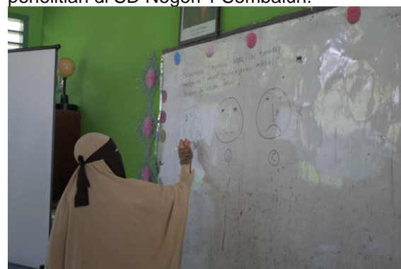
Gambar 2. Guru memilih sesuai emosinya dipertanyaan pertama

(6), tim membimbing diskusi untuk memecahkan permasalahan yang muncul dari tanggapan dan pendapat guru dengan membuat tabel pemecahan yang intinya berisi kondisi saat ini, kondisi sekarang, penanggung jawab, dan waktu yang dibutuhkan untuk menyelesaikannya. Selanjutnya tim dan guru akan terus berkomunikasi untuk mengatualisasi kan hasil teknik moderasi implementasi model pembelajaran mitigasi bencana di sekolah dasar. Berikut adalah foto-foto kegiatan penelitian di SD Negeri 1 Sembalun.