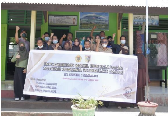
Gambar 6. Foto bersama tim dengan guru di depan SD Negeri 1 Sembalun