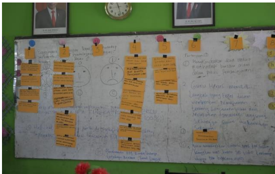
Gambar 4. Kartu-kartu usulan (zoop) yang ditempatkan sesuai pokok pikiran