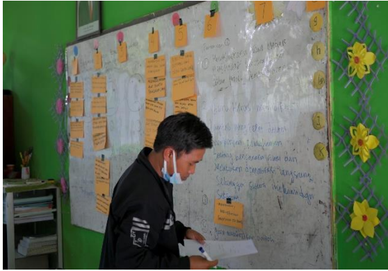
Gambar 3. Guru menulis kalimat yang mewakili pokok pikiran yang diusulkan