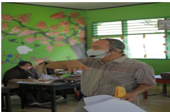
Gambar 5. Tim memimpin teknik moderasi