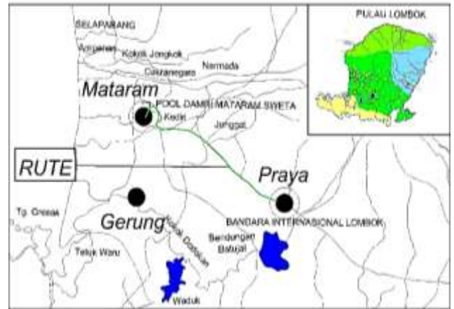
Gambar 3. Peta Rute Pool Damri Mataram - BIL

menggunakan metode Pacific Consultant International (PCI) [5].