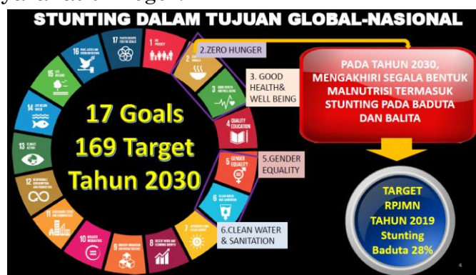
Gambar 1. Stunting dalam rancangan global-nasional

Pencegahan stunting tersebut penting dilaksanakan dengan aksi konvergensi. Aksi konvergensi merupakan tindakan yang dilakukan untuk mencegah stunting, dengan berkoordinasi lintas sektor. Yang pada awalnya terdapat persepsi bahwa stunting merupakan permasalahan yang diselesaikan oleh kementerian agama saja, namun ternyata menjadi tanggung jawab bersama lintas sektor. Berikut ini adalah stunting dalam rancangan tujuan global dan nasional Indonesia. Sebagaimana yang disampaikan oleh Dr. Kirana Pritasari, MQIH selaku direktur jenderal kesehatan masyarakat di Bogor.