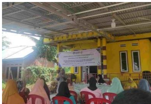
Gambar 1. Tim Pengabdian sedang menyampaikan materi mengenai stunting

Tim pengabdian menjelaskan mengenai pengertian stunting yaitu anak pendek atau kerdil dibandingkan dengan anak seusianya. Penyebab stunting adalah kekurangan nutrisi pada ibu saat hamil, dan menyusui sehingga pertumbuhan anaknya terganggu. Dampak stunting yaitu kemampuan kognitif dan motorik yang rendah sehingga akan mengganggu aktivitas anak tersebut. Upaya yang dapat dilakukan untuk mencegah stunting yaitu melalui asupan makanan yang bernutrisi melalui calon ibu dan ibu dari anak-anak, seperti terlihat pada Gambar 1.