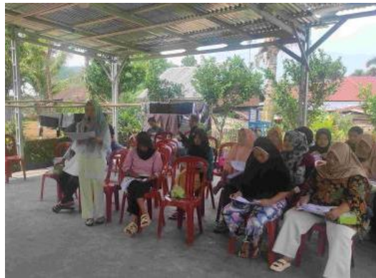
Gambar 2. Salah seorang mitra Mitra sedang bertanya kepada Tim Pengabdian saat sesi diskusi