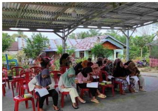
Gambar 3. Mitra Mitra sedang mengisi kuisisioner posttest

Evaluasi yang dilakukan yaitu dengan mengisi kuisisioner sebelum (pretest) dan sesudah (posttest) materi sosialisasi disampaikan. Evaluasi bertujuan untuk mengukur pemahaman mitra tentang materi yang diberikan oleh tim pengabdian. Mitra sedang mengisi kuisisioner post-test , seperti terlihat pada Gambar 3.