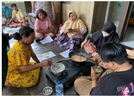
Gambar 2. Pelatihan Pembuatan Tepung Jagung dan Kacang Hijau, Krim Sup Jagung, dan Puding Kacang Hijau