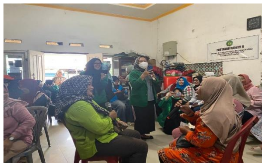
Gambar 4. Roleplay

Hasil evaluasi dari kegiatan pengabdian kepada masyarakat ini didapatkan hasil karakteristik para kader posyandu mawar RW.04 Kelurahan Cilincing Kecamatan Cilincing, seperti terlihat pada Tabel 1.