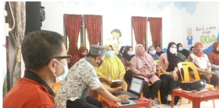
Gambar 1. Tim PKM Menyampaikan Materi

Pelatihan dilaksanakan pada ruang pertemuan Kantor Kepala Desa dengan beberapa materi pelatihan sesuai dengan modul yang sudah direncanakan. Pelaksanaan pelatihan ini seperti pada Gambar 1 berikut.