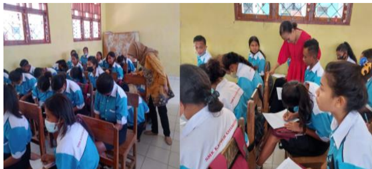
Gambar 4. Pelatihan Pembuatan CV didampingi oleh Tim Pengabdian

Setelah pemberian materi pelatihan kepada peserta pelatihan, peserta diminta untuk memuat CV yang didampingi oleh tim pengabdian dan ditindaklanjuti dengan mendiskusikan CV yang telah dibuat. Kegiatan ini bertujuan untuk memberikan gambaran dan memperbaiki CV yang telah dibuat beberapa perwakilan dari peserta pelatihan. Walaupun kegiatan ini dilakukan dengan peran aktif tim pengabdian untuk mengevaluasi CV yang telah dibuat peserta, namun pada dasarnya, peserta pelatihan telah mampu menilai dan mengevaluasi hasil CV yang telah mereka buat, karena sebelumnya tim pengabdian telah menyampaikan materi-materi pokok, tips dan trik pembuatan CV. Dari hasil ini dapat ditarik kesimpulan bahwa materi yang disampaikan dapat diterima baik dan dipahami oleh peserta pelatihan. Selain itu, sepenuhnya penulis mengapresiasi peserta pelatihan terkait peserta pelatihan yang aktif dan penuh antusiasme dalam mengikuti pelatihan seperti pada Gambar 4 berikut.