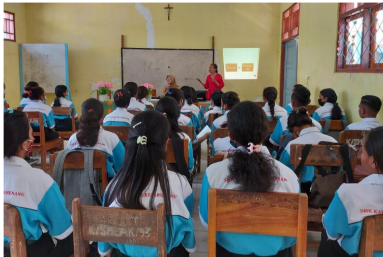
Gambar 2. Pengenalan Awal tentang CV

Selanjutnya pihak mitra menyerahkan sepenuhnya keberlangsungan kegiatan pelatihan kepada tim pengabdian untuk dilaksanakan sesuai dengan rencana yang telah disepakati sebelumnya. Sebelum masuk pada kegiatan pemberian materi terlebih dahulu tim pengabdian mengajak siswa-siswi untuk berdiskusi tentang pemahaman dasar pelajar tentang pembuatan CV, dari hasil diskusi tersebut didapati bahwa ternyata mahasiswa memiliki pemahaman yang sangat rendah terkait CV, bahkan sebagian dari mereka tidak memiliki pengetahuan sama sekali tentang CV padahal pemahaman terkait CV bagi pelajar kelas 3 harus dimiliki sebagai bekal untuk terjun dalam dunia kerja. Berbekal tentang informasi dasar ini tim menggunakan contoh-contoh CV untuk menunjukkan contoh-contoh, ragam CV. Dalam pengenalan awal tentang CV ini juga pelajar diminta untuk memilih CV yang bagus menurut mereka sebelum dilakukannya kegiatan penyampaian materi. Pelaksanaan kegiatan ini seperti pada Gambar 2 berikut.