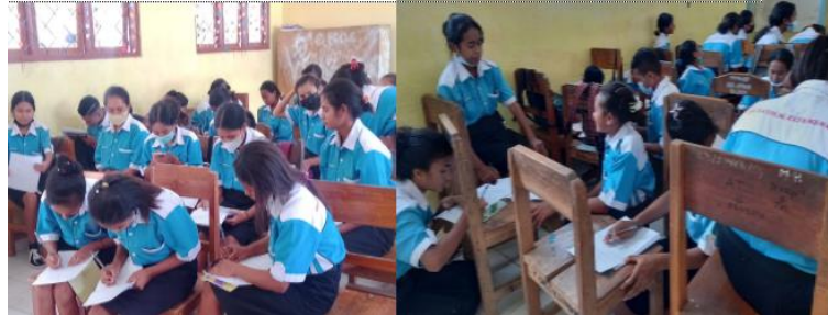
Gambar 5. Pengisian Angket Respon Peserta Kegiatan

Gambaran yang diharapkan didapatkan adalah terkait kemanfaatan pelatihan bagi peserta pelatihan, tingkat pemahaman materi yang disampaikan serta teknik pengajaran yang digunakan. Dalam evaluasi ini tim pengabdian memberikan angket kepada seluruh peserta pelatihan untuk memberikan gambaran terkait kegiatan yang telah dilaksanakan. Pengisian angket seperti pada Gambar 5 berikut.