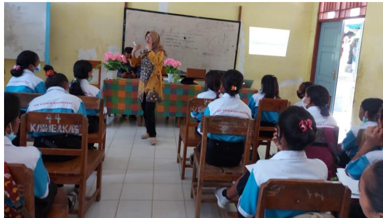
Gambar 3. Pemberian Materi tentang CV

keaktifan peserta pelatihan bertanya, berdiskusi dan mengemukakan pendapat terkait materi yang disampaikan. Pelaksanaan kegiatan pelatihan ini berjalan dengan sangat baik sesuai dengan jadwal yang sebelumnya telah ditetapkan seperti pada Gambar 3 berikut.