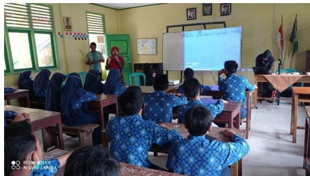
Gambar 2. Pemaparan Materi Pelatihan

Kegiatan dilaksanakan setelah jam pembelajaran sekolah telah selesai yaitu antara rentang waktu pukul 13.00 – 15.00WIB. Pada saat pelaksanaan kegiatan pengabdian tim pengabdian beranggotan dua orang dosen dari program studi Pendidikan Bahasa Inggris dan program studi pendidikan teknologi informasi kemudian satu orang mahasiswa program studi Pendidikan Teknologi Informasi. Pelatihan pembuatan video mengacu pada mata pelajaran Bahasa Inggris dengan materi pokok prosedur teks selama satu bulan.