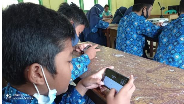
Gambar 4. Siswa Mempraktekan Materi Pelatihan

mencurahkan segala bentuk kreatifitasnya untuk menyajikan hasil video menjadi lebih menarik. Proses editing video memanfaatkan aplikasi Kinemaster. Aplikasi Kinemaster adalah aplikasi editing video agar video hasil rekaman terlihat semakin menarik. Aplikasi Kinemaster dapat dijalankan melalui handphone berbasis sitem android maupun iOS pada produk apple (Darmawan & Hamidi, 2018). Kegiatan editing menggunakan Smartphone seperti Gambar 4 berikut.