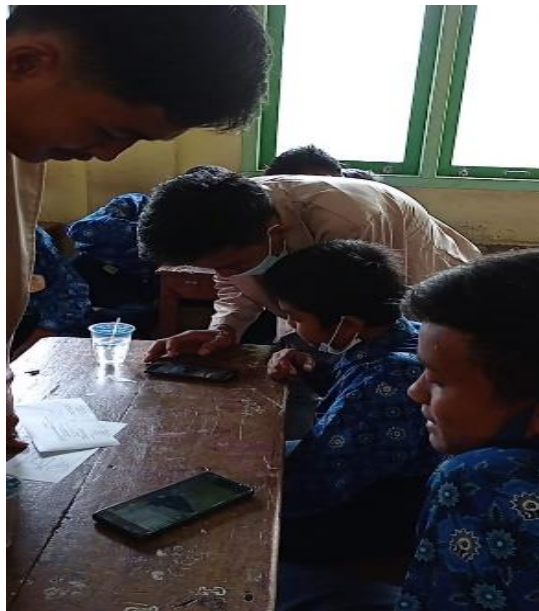
Gambar 3. Pengaturan Smartphone

Tahapan pertama yang harus peserta lakukan adalah melakukan pengaturan pada smartphone yang akan digunakan dalam proses pengambilan gambar sekaligus editing video. Seperti nampak pada gambar 3 mahasiswa sebagai tim pengabdian sedang memandu salah satu peserta melakukan penaturan. Pemanduan dilakukan juga saat peserta melakukan pengunduhan aplikasi yang nantinya akan digunakan untuk melakukan editing video seperti pada Gambar 3 berikut.