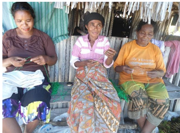
Gambar 3. Pelatihan dan Penyuluhan Mengikat Rumput Laut

Secara urut-urutan, kegiatan dimulai dengan pelatihan dan penyuluhan terkait mengikat rumput laut dengan menggunakan bahan tali yang tepat, akan tetapi proses kegiatan tidak lupa juga beri kesempatan kepada peserta (masyarakat pembudidaya rumput laut) untuk langsung bertanya kepada instruktur (tim pengabdian) jika ada dalam proses pelatihan teknik mengikat bibit rumput laut yang masih belum dipahami dan masih terdapat kekeliruan. Pelaksanaan kegiatan pelatihan dan penyuluhan seperti pada Gambar 3 berikut.