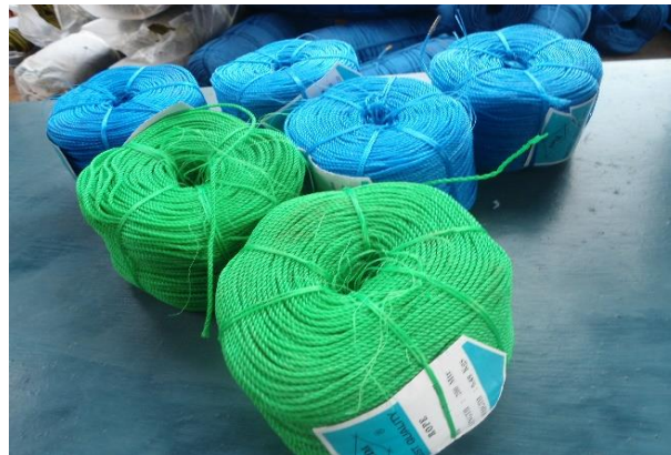
Gambar 2. Tali Dari Bahan Nilon

Pada tahap pelaksanaan kegiatan, konsentrasi diarahkan pada kegiatan pelatihan dan penyuluhan teknik mengikat bibit rumput laut sembari memberi informasi jenis tali yang baik untuk digunakan sehingga tidak mudah putus atau terkelupas bahkan dalam pembudidayaan, jika kualitas tali buruk akan meninggalkan serpihan pada perkembangan thallus sehingga kualitas menurun. Jenis tali yang baik untuk digunakan adalah tali dengan bahan nilon seperti pada Gambar 2 berikut.