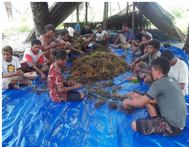
Gambar 4. Masyarakat pembudidaya sedang mempraktekan teknik mengikat bibit rumput laut

Setelah kegiatan pelatihan dan penyuluhan teknik mengikat bibit rumput laut, untuk mengukur pemahaman para pembudidaya kemudian dipraktikkan pada bibit yang telah disiapkan hal ini dimaksudkan agar adanya peningkatan pemahaman masyarakat petani pembudidaya rumput laut. Kegiatan dapat dikatakan berhasil oleh karena masyarakat pembudidaya telah berpengalaman dan hanya merubah sedikit saja pola pengikatannya sehingga saat membuka simpul tali saat panen dapat dilakukan dengan mudah. Praktek teknik mengikat bibit rumput laut yang dilakukan masyarakat petani rumput laut dapat dilihat pada Gambar 4 berikut.