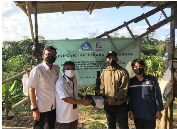
Gambar 2. Penyerahan Alat dari Tim PKM ke Mitra

Setelah dilakukan penyerahan alat program PKM di mitra B.A.P Production Kelurahan Karang Joang, Kota Balikpapan terjadi perubahan kondisi yaitu adanya tambahan fasilitas wadah pakan di kandang mitra. Karena peralatan yang diserahkan berkapasitas 2 liter pakan, sehingga mitra mempunyai alternatif wadah pakan untuk ternak dan mitra mampu menghemat wadah pakan. Pada saat penyerahan alat, langsung dilakukan instalasi ke kandang ayam B.A.P Production. Karena proses instalasi yang memerlukan waktu 1 hari saja maka dilakukan proses instalasi sambil memberi penjelasan ke mitra tentang pemasangan alat ini. Proses instalasi alat pakan seperti pada Gambar 3 berikut.