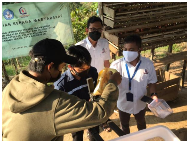
Gambar 5. Pendampingan Pemakaian Peralatan oleh Narasumber

Selain itu pendampingan penggunaan produk alat kepada pengelola kandang ayam berdampak pada meningkatnya pemahaman mitra terhadap manajemen pakan yang berbasis elektronik dengan tepat dan benar. Pendampingan pemakaian peralatan seperti pada Gambar 5 berikut.