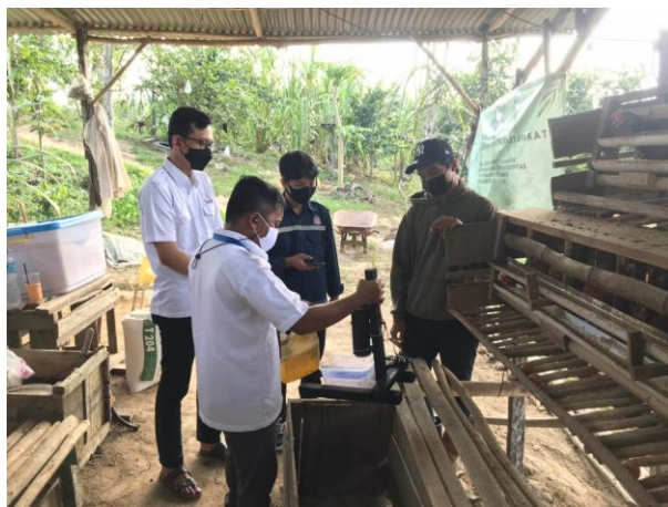
Gambar 4. Sosialisasi dan edukasi sistem teknologi pemberi pakan

Tahapan sosialisasi program PKM yang di jalankan tim pengusul bersama mahasiswa berjalan dengan lancar dan para karyawan mitra menjadi lebih paham terhadap cara menggunakan peralatan pemberi pakan yang tepat. Para peserta sosialisasi juga mulai memahami bagaimana sistem pemberi pakan dengan elektronika lebih efektif dan efisien, serta cocok dipakai di kandang mitra yang memiliki wadah pakan yang memanjang. Hal yang tidak kalah penting adalah para peserta bisa memakai produk PKM yakni teknologi tepat guna yang berbasis kontrol jarak jauh dengan lebih tepat dan efisien setelah sosialisasi dari tim PKM. Sosialisasi dan edukasi sistem teknologi pemberi pakan seperti pada Gambar 4 berikut.