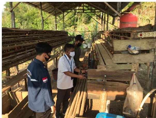
Gambar 3. Pemasangan Instalasi Peralatan di Kandang Ayam Mitra

Setelah dilakukan penyerahan alat program PKM di mitra B.A.P Production Kelurahan Karang Joang, Kota Balikpapan terjadi perubahan kondisi yaitu adanya tambahan fasilitas wadah pakan di kandang mitra. Karena peralatan yang diserahkan berkapasitas 2 liter pakan, sehingga mitra mempunyai alternatif wadah pakan untuk ternak dan mitra mampu menghemat wadah pakan. Pada saat penyerahan alat, langsung dilakukan instalasi ke kandang ayam B.A.P Production. Karena proses instalasi yang memerlukan waktu 1 hari saja maka dilakukan proses instalasi sambil memberi penjelasan ke mitra tentang pemasangan alat ini. Proses instalasi alat pakan seperti pada Gambar 3 berikut.