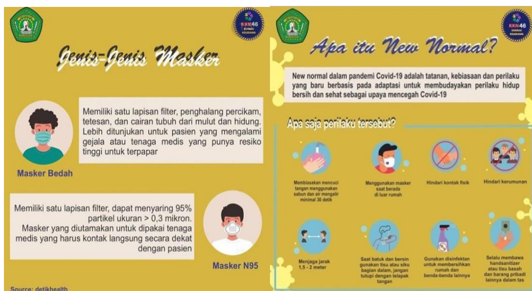
Gambar 3. Foto Bukti Pelaksanaan Langkah 2

Langkah kedua yaitu memberikan edukasi terkait jenis-jenis masker, cara menggunakan masker dan adaptasi kebiasaan baru New Normal yang di sampaikan melalui bentuk poster. Program Kerja ini dilaksanakan melalui sosial media atau daring dengan membagikan poster yang berisi edukasi masker kepada pihak dan masyarakat setempat. Adapun contoh media yang digunakan pada langkah kedua ini seperti pada Gambar 3 berikut.