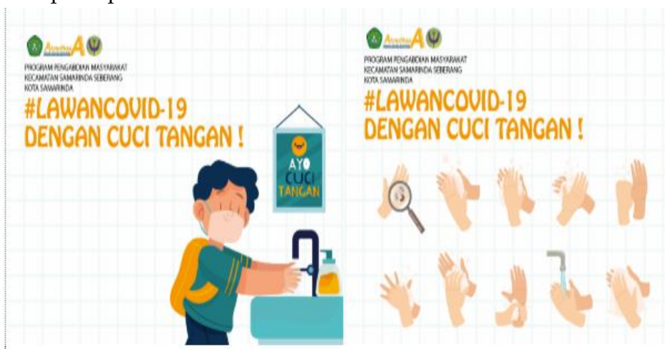
Gambar 2. Foto Bukti Pelaksanaan Langkah 1

Selain itu, berdasarkan hasil kuesioner setelah menonton video sebanyak 83,3% responden tahu bagaimana cara mencuci tangan yang baik dan benar sesuai standar WHO. Sehingga dapat disimpulkan bahwa evaluasi dari kegiatan langkah pertama ini berhasil karena adanya peningkatan pemahaman di masyarakat mengenai bagaimana mencuci tangan sesuai standar WHO. Adapun media yang digunakan pada kegiatan pertama seperti pada Gambar 2 berikut.