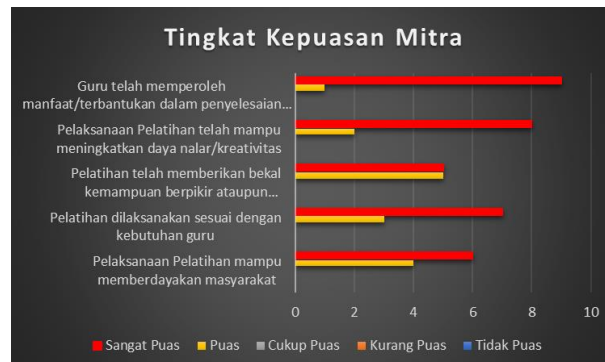
Gambar 5. Tingkat Kepuasan Mitra Terhadap Pelaksanaan Pelatihan

pembelajaran yang kreatif tentunya juga sebagai alat bantu guru dalam menyampaikan materi pembelajaran selama masa pandemi. Sedangkan berdasarkan hasil kuesioner kepuasan mitra terhadap pelatihan diperoleh kategori puas dan sangat puas. Tingkat kepuasan mitra terhadap pelaksanaan pelatihan dapat dilihat pada Gambar 5 berikut.