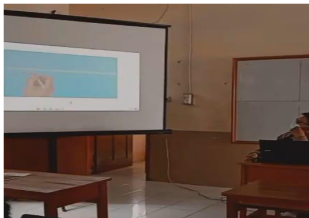
Gambar 4. Presentasi hasil pembuatan media pembelajaran

Setelah pembuatan media pembelajaran tersebut, peserta mempresentasikan media pembelajaran yang telah dibuat. Tujuan kegiatan ini adalah agar para peserta dapat saling berbagi pengalamannya dalam membuat media pembelajaran video scribe sparkol dan mendapat saran dari peserta lain sehingga media pembelajaran yang dibuat dapat lebih baik lagi. Kegiatan presentasi media pembelajaran berlangsung seperti pada Gambar 4 berikut.