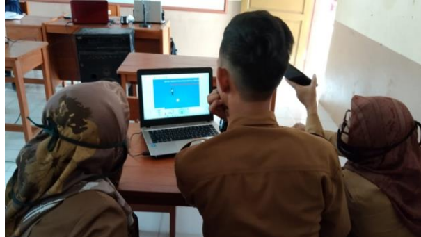
Gambar 3. Peserta Membuat Media Pembelajaran Menggunakan Video Scribe Sparkol

Kemudian mengumpulkan asset berupa gambar dan bahan materi pelajaran untuk dibuat pada aplikasi video scribe sparkol . Menggunakan peta konsep sangat membantu mereka dalam mengatur pengetahuan tentang apa yang mereka pelajari (Dewi, 2016). Dengan demikian, peta konsep dapat membantu peserta pelatihan dalam menyusun rencana materi yang akan dituangkan dalam aplikasi video scribe sparkol . Kegiatan membuat media pembelajaran menggunakan video scribe sparkol oleh mitra seperti pada Gambar 3 berikut.