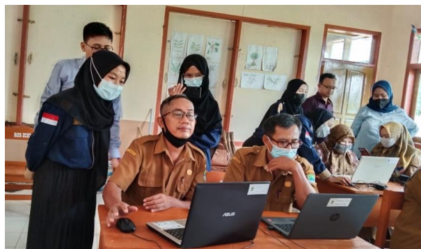
Gambar 2. Pendampingan Oleh Mentor Dalam Memahami Tools Aplikasi

Kegiatan diawali dengan mengenalkan aplikasi video scribe sparkol dan proses instalasi pada perangkat notebook . Selanjutnya dipaparkan tools yang ada pada aplikasi video scribe sparkol dan langkah-langkah pembuatan media pembelajaran. Dalam memahami penggunaan tools pada aplikasi, peserta dibantu oleh mentor sehingga lebih memudahkan peserta dalam menggunakan aplikasi video scribe sparkol . Sebuah proses mentoring penting untuk memfasilitasi peningkatan kinerja manusia (Anwar et al., 2013). Kegiatan ini berlangsung dengan baik seperti pada Gambar 2 berikut.