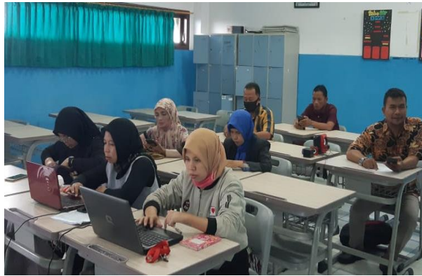
Gambar 2. Proses Pengenalan dan Pengajaran Materi Dasar TOEIC

Kegiatan selanjutnya adalah melatih skill atau kemampuan guru dalam tes TOEIC meliputi kemampuan menyimak ( listening comprehension ) dan kemampuan membaca ( reading comprehension ). Pelatihan kemampuan listening comprehension dan reading comprehension dilakukan dengan menerapkan tips dan trik jitu dalam menjawab tiap bagian soal TOEIC. Pelatihan ini bertujuan mengukur kemampuan berbahasa Inggris baik lisan maupun tulisan meliputi teks lisan yang disimak dan teks bacaan yang dibaca.