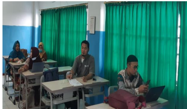
Gambar 3. Proses Pelatihan Kemampuan ( Skill ) guru

dalam reading dapat membantu menjawab persoalan yang diungkapkan dalam teks bacaan (Schmidgall, J., & Powers, 2021). Proses pelatihan kemampuan guru SMA Harapan 3 Deli Serdang seperti pada Gambar 3 berikut.