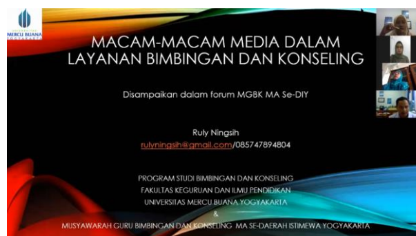
Gambar 2. Pemaparan Materi 2