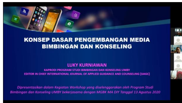
Gambar 1. Pemaparan Materi 1