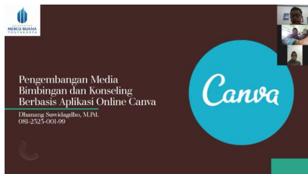
Gambar 3. Pemaparan Materi 3