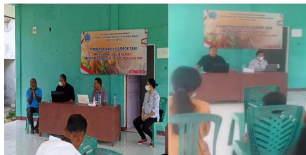
Gambar 2. Kegiatan Penyuluhan pada Kelompok Tani Moko Desa Ondorea Barat

Kegiatan penyuluhan berjalan dengan lancar dan baik dimana peserta mendengarkan dengan cermat dan setiap sesi diberikan kesempatan bagi peserta untuk bertanya, dan pertanyaan disampaikan berdasarkan pengalaman yang dialami peserta. Dokumentasi kegiatan PkM seperti pada Gambar 2 berikut.