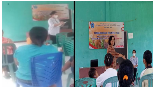
Gambar 3. Kegiatan Pelatihan pada Kelompok Tani Moko Desa Ondorea Barat

Berikut ini adalah beberapa dokumentasi kegiatan pelatihan seperti tampak pada Gambar 3 berikut.