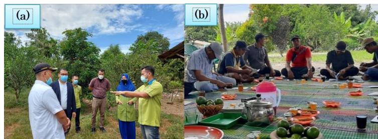
Gambar 2. Assessment dan Sosialisasi Program. (a) Saat assesment dan observasi di lahan pertanian jeruk. (b) Saat sosialisasi rencana pelaksanaan program kemitraan

Setelah kegiatan PKM disetujui oleh kedua belah pihak, tim dosen melakukan menyusun perencanaan pelaksanaan program serta berkoordinasi dengan pimpinan universitas guna mensuport program kemitraan masyarakat ini. Pada bulan mei 2021, tim dosen kembali ke Desa Sekoci guna menyampaikan menyampaikan sosialisasi perencanaan program kemitraan masyarakat dengan petani jeruk di Desa Sekoci. Tim dosen pelaksana PKM selanjutnya akan melakukan penyusunan modul berdasarkan materi-materi yang akan disampaikan pada saat pelatihan nantinya. Adapun pelaksanaan assesment dan sosialisasi program seperti pada Gambar 2 berikut.