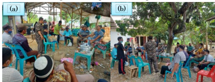
Gambar 4. (a) Pemaparan materi agrosociopreneur . (b) Sesi diskusi

Pada sesi kedua materi pelatihan, dipaparkan materi tentang pentingnya pengembangan agro wisata berbasis sociopreneurship . Dalam sesi ini disampaikan bagaimana dampak positif dari pengembangan agrosociopreneur ini memiliki potensi dan prospek yang menguntungkan yaitu membuka pekerjaan, meningkatkan penghasilan dan kesejahteraan masyarakat desa. Kegiatan ini ditutup dengan diskusi terkait respon peserta pelatihan terhadap materi yang disampaikan dan dilanjutkan foto bersama. Dokumentasi kegiatan dapat dilihat pada Gambar 4 berikut.