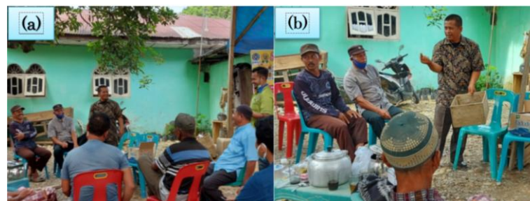
Gambar 3. Sesi materi pertama (a) Pemaparan materi pengembangan sistem refugia. (b) Pemaparan materi budidaya lebah madu

Pelaksanaan kegiatan dilakukan pada tanggal 16 Juni 2021. Pembukaan dilakukan oleh Kepala Desa Sekoci kemudian dilajut sesi pertama materi oleh tim dosen yang memberikan paparan materi mengenai pengendalian hama alami dan optimalisasi lahan pertanian melalui penerapan sistem refugia dan pengembangan lebah madu berbasis pertanian jeruk. Dalam sesi ini dijelaskan pentingnya mengendalikan tingkat serangan hama dengan menciptakan keseimbangan ekosistem di lahan jeruk. Kegiatan pada sesi pertama dapat dilihat pada Gambar 3 berikut.