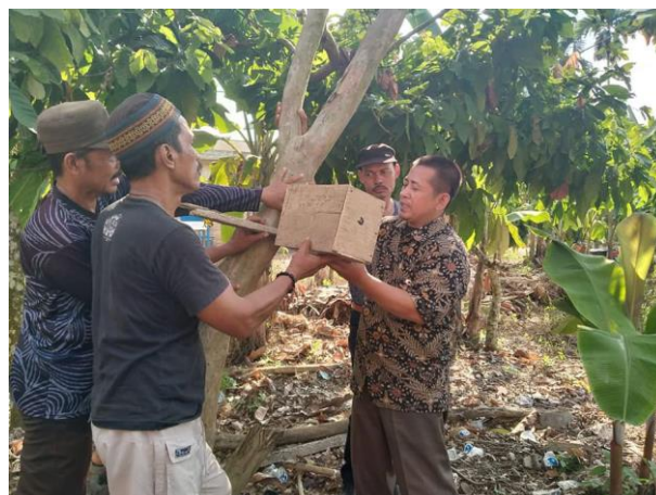
Gambar 5. Praktik pencangkakan koloni lebah madu trigona.sp .

Setelah selesai pemaparan materi dan diskusi, kemudian dilanjutkan dengan praktek implementasi pembelajaran dengan melakukan pencangkakan salah satu sarang koloni lebah madu jenis trigona.sp yang ada di pepohonan di perkebunan milik petani. Proses pencangkakan koloni ini dilakukan setelah awalnya melakukan praktik pembuatan kotak stup sebagai wadah pengembangan koloni lebah madu. Suasana praktik pencangkakan koloni lebah ini dapat dilihat pada Gambar 5 berikut.