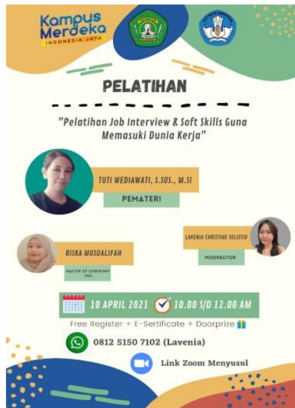
Gambar 1. Pamflet Kegiatan

Kegiatan Pelatihan ini dilaksanakan pada Hari Sabtu tanggal 10 April 2021, pelaksanaan kegiatan ini berlangsung dari pukul 10.00-12.00 WITA. Sebelum acara dimulai, panitia memberikan Google Form (Pra Test) untuk mengisi sebagai daftar hadir sekaligus melihat seberapa pengetahuan peserta tentang job interview dan sebelum menutup acara panitia memberikan Google Form (Pre Test) untuk melihat seberapa jauh pemahaman peserta setelah mengikuti kegiatan ini dari awal sampai akhir.