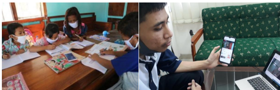
Gambar 4. Instalasi Google Meet

Kegiatan berupa pemberian edukasi mengenai tata cara instalasi google meet secara offline berhasil dilakukan di mana para siswa mampu menginstall google meet diperangkat handphone. Dokumentasi selama kegiatan instalasi google meet dapat ditunjukkan pada Gambar 4.