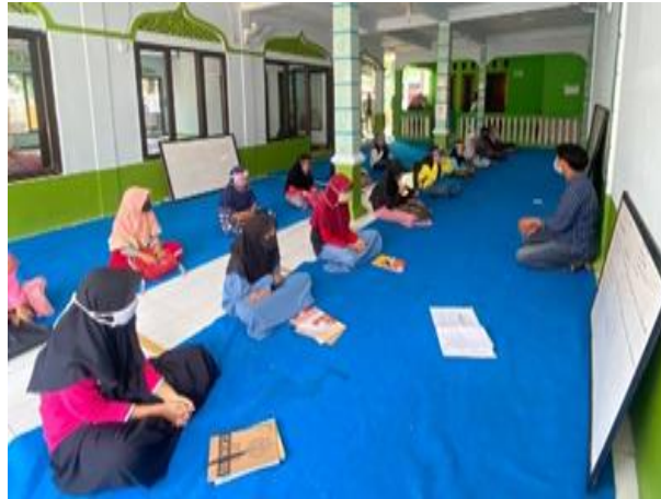
Gambar 3. FGD Aplikasi Google Classroom dan Google Meet

Kegiatan Pelaksanaan PkM di kampung Babakan Tengah Desa Cilebut Barat yang dilaksanakan melalui FGD kepada siswa usia sekolah SD dan SMP guna meningkatkan edukasi, informasi mengenai teknologi pembelajaran saat ini. Dokumentasi selama kegiatan FGD dapat ditunjukkan pada Gambar 3.