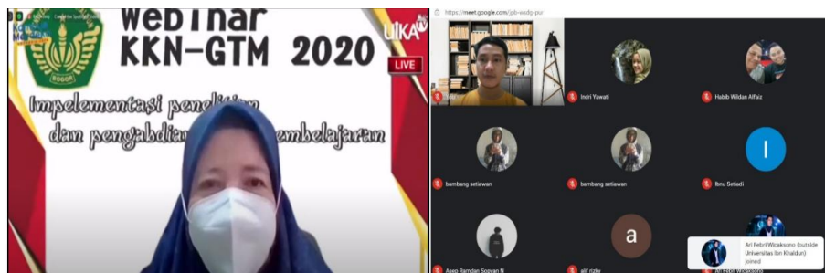
Gambar 1. Sosialisasi dan Pengarahan Rencana Kegiatan PkM