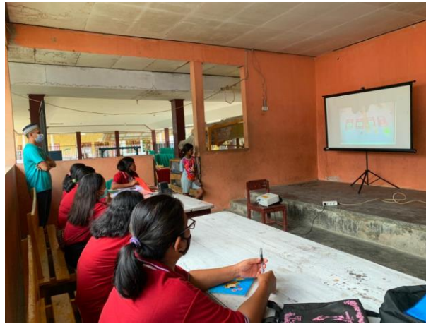
Gambar 1. Kader posyandu sedang menyaksikan video “kuliah kader”

Disetiap jeda episode, maka akan dilakukan tanya jawab terkait dengan video yang telah ditonton. Setelah semua video ditonton maka akan dilakukan posttest seperti pada Gambar 2 berikut.