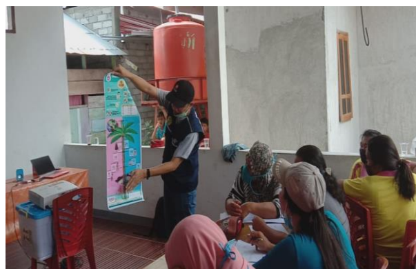
Gambar 3. Penjelasan tentang penggunaan poster pintar

Pada kegiatan ini, dijelaskan pula tentang penggunaan poster pintar, sesuai pada video episode 3 kuliah kader ini (1000 Days Fund, 2021d). Poster ini digunakan untuk mendeteksi status gizi anak umur kurang dari 2 tahun berdasarkan tinggi badan per umur. Kegiatan ini seperti pada Gambar 3 berikut.