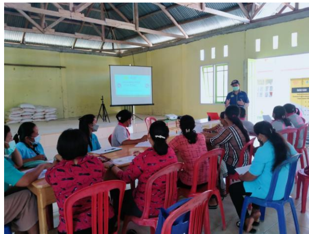
Gambar 2. Suasana diskusi setelah menyaksikan video “Kuliah Kader”

Disetiap jeda episode, maka akan dilakukan tanya jawab terkait dengan video yang telah ditonton. Setelah semua video ditonton maka akan dilakukan posttest seperti pada Gambar 2 berikut.