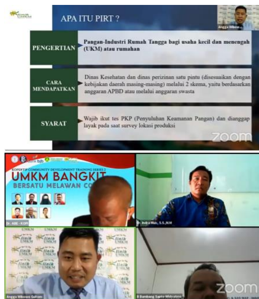
Gambar 2. Sesi Penjelasan Materi Tentang Pengurusan Legalitas Jenis P-IRT dan Sesi Tanya Jawab Secara Langsung Antara Peserta dan Pemateri

narasumber. Dengan adanya materi ini diharapkan seluruh pihak memahami kondisi permasalahan dan solusi bagi UMKM dimasa pandemi covid-19 yang saat ini melanda Indonesia. Adapun dokumentasi pelaksanaan kegiatan ini seperti pada Gambar 2 berikut.