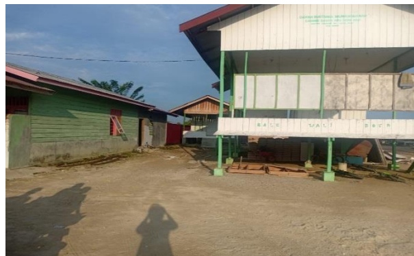
Gambar 2. Survei Mitra dan lokasi pemberian alat cuci tangan Moveable Hand Washer (MHW) di Dayah

Pelaksanaan survai mitra dilakukan pada tanggal 22 Juli 2020 dengan hasil yang didapat yaitu mengetahui beberapa langkah yang sudah dilakukan oleh Desa Lhokbanie Relokasi Perumahan Pusong untuk mengantisipasi penyebaran Covid-19. Ternyata dari Desa belum ada disediakan tempat alat cuci tangan Moveable Hand Washer (MHW) untuk menjaga kebersihan tangan terutama di tempat umum seperti disekolah, meunasah, dayah pesantren juga tempat kepala dusun yang memang sering berkumpul bapak-bapak dan pemuda setempat. Hasil survei lokasi pengabdian seperti pada Gambar 2 berikut.