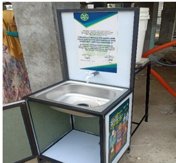
Gambar 4. Konsultasi Alat Wastafel Moveable Hand Washer (MHW) yang Siap Pakai

Setelah dilakukan diskusi dan melihat ketersediaan alat dan bahan maka alat cuci tangan Moveable Hand Washer (MHW) kepada masyarakat desa perumahan pusong dirangkai sedikit berbeda dengan desain awal. Adapun gambar alat yang sudah jadi dan akan didistribusikan kepada masyarakat adalah seperti pada Gambar 4 berikut.