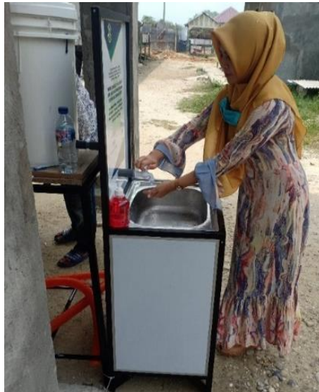
Gambar 7. Perawatan Alat cuci tangan Moveable Hand Washer (MHW) di Dayah Pesantren Perumahan Pusong

Selanjutnya tahap monitoring dan evaluasi. Pada tahap ini, tim melakukan beberapa kegiatan diantaranya: (1) Tim Pengabmas berkoordinasi dengan Tim Monitoring dan Evaluasi Unsam beserta Kepala dusun dalam melakukan monitoring dan evaluasi kegiatan. (2) Tim Pengabmas melakukan kunjungan ke tiap sarana yang menggunakan alat cuci tangan, untuk melihat kendala ataupun masalah yang dihadapi terkait penggunaan alat cuci tangan. (3) Mencatat dan melakukan perencanaan terkait masalah alat cuci tangan yang dialami oleh masyarakat yang menggunakannya.. Masalah yang ditemukan adalah baut penahan keran air sedikit longgar, tim pengabmas memperbaiki dengan alat yang telah disediakan. Tahap monitoring dan evaluasi ini seperti pada Gambar 8 berikut.