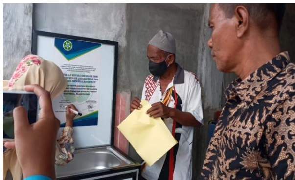
Gambar 6. Simbolis Penyerahan Alat cuci tangan Moveable Hand Washer (MHW) di Meunasah

Hasil desain yang sudah dibuat selanjutnya dilakukan pembuatan alat. Alat yang sudah selesai dibuat selanjutnya diserahkan kepada mitra yang tepatnya dilakukan pada tanggal 26 Agustus 2020 dengan simbolis penyerahan alat cuci tangan Moveable Hand Washer (MHW) kepada kepala dusun Perumahan Pusong seperti pada Gambar 6 berikut.