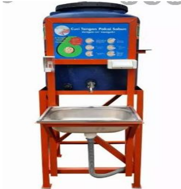
Gambar 3. Desain Awal Alat Wastafel Moveable Hand Washer (MHW)

mitra dengan tim Pengabdian Universitas Samudra seperti pada Gambar 3 berikut.