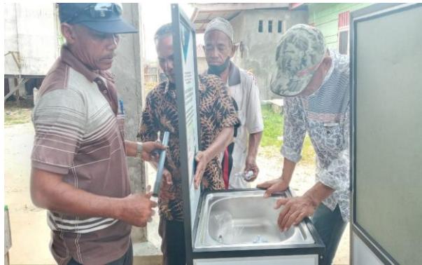
Gambar 5. Proses Penyiapan dan Perangkaian Alat Cuci Tangan Moveable Hand Washer (MHW) di Dayah Pesantren

meunasah. Pelaksanaan pelatihan penggunaan alat cuci tangan Moveable Hand Washer (MHW) seperti pada Gambar 5 berikut.