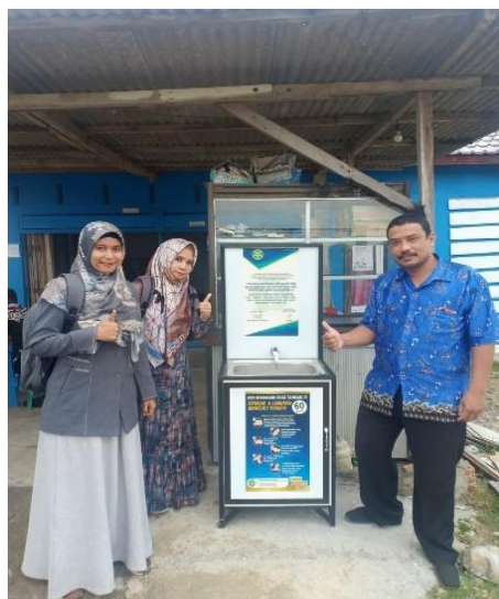
Gambar 8. Monitoring dan Evaluasi dilakukan oleh Tim dari Unsam

Selanjutnya tahap monitoring dan evaluasi. Pada tahap ini, tim melakukan beberapa kegiatan diantaranya: (1) Tim Pengabmas berkoordinasi dengan Tim Monitoring dan Evaluasi Unsam beserta Kepala dusun dalam melakukan monitoring dan evaluasi kegiatan. (2) Tim Pengabmas melakukan kunjungan ke tiap sarana yang menggunakan alat cuci tangan, untuk melihat kendala ataupun masalah yang dihadapi terkait penggunaan alat cuci tangan. (3) Mencatat dan melakukan perencanaan terkait masalah alat cuci tangan yang dialami oleh masyarakat yang menggunakannya.. Masalah yang ditemukan adalah baut penahan keran air sedikit longgar, tim pengabmas memperbaiki dengan alat yang telah disediakan. Tahap monitoring dan evaluasi ini seperti pada Gambar 8 berikut.