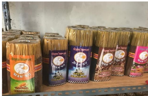
Gambar 2. Dupa menggunakan kemasan plastic

Tahap selanjutnya adalah perancangan kemasan. Selama ini, UMKM Dupa Man'ku menggunakan kemasan plastik. Pada kegiatan pengabdian ini, dosen pengabdian dan pemilik UMKM merancang kemasan baru berbentuk tabung menggunakan bahan dasar kertas dan bambu. Desain kemasan dupa berbentuk tabung memiliki desain praktis dan fungsional sehingga menjadi daya tarik visual bagi konsumen. Kemasan tabung juga memberikan fungsi penyimpanan yang baik sehingga aroma wangi dupa tetap terjaga. Selain itu, kemasan tabung belum banyak digunakan oleh produsen dupa lainnya. Dengan demikian, kemasan dupa tabung ini menjadi keunggulan kompetitif dalam memasarkan produk dupa premium UMKM. Adapun kemasan dupa plastik disajikan pada Gambar 2 berikut.