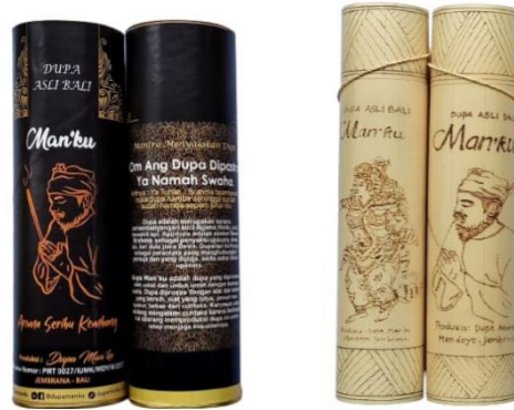
Gambar 3. Kemasan Dupa Tabung Berbahan Kertas dan Berbahan Bambu

itu, kemasan dupa bambu memiliki ukiran motif wayang Bali yang menjadi ciri khas (keunikan) budaya atau kearifan lokal Bali. Hal ini menjadi keunggulan kemasan bambu, yaitu ukiran wayang dapat dipesan sesuai permintaan konsumen. Kemasan ini dirancang dengan ukuran tinggi 31 cm dan diameter 5 cm. Dengan demikian, perancangan kemasan dikatakan telah memenuhi tiga aspek penilaian, yaitu aspek ekonomi, sosial, dan lingkungan. Kemasan dupa tabung disajikan pada Gambar 3 berikut.