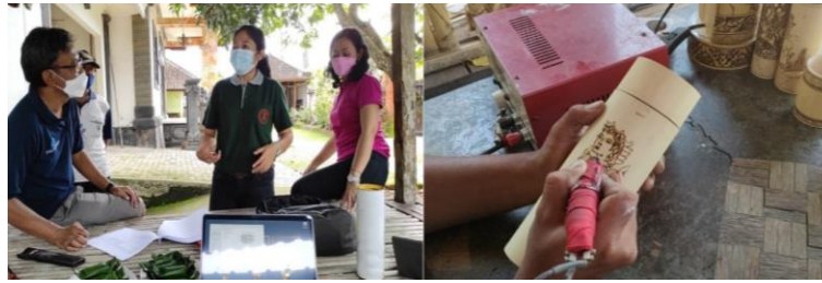
Gambar 1. Sosialisasi dan Workshop Perancangan Kemasan Bambu

Tahap selanjutnya adalah perancangan kemasan. Selama ini, UMKM Dupa Man'ku menggunakan kemasan plastik. Pada kegiatan pengabdian ini, dosen pengabdian dan pemilik UMKM merancang kemasan baru berbentuk tabung menggunakan bahan dasar kertas dan bambu. Desain kemasan dupa berbentuk tabung memiliki desain praktis dan fungsional sehingga menjadi daya tarik visual bagi konsumen. Kemasan tabung juga memberikan fungsi penyimpanan yang baik sehingga aroma wangi dupa tetap terjaga. Selain itu, kemasan tabung belum banyak digunakan oleh produsen dupa lainnya. Dengan demikian, kemasan dupa tabung ini menjadi keunggulan kompetitif dalam memasarkan produk dupa premium UMKM. Adapun kemasan dupa plastik disajikan pada Gambar 2 berikut.