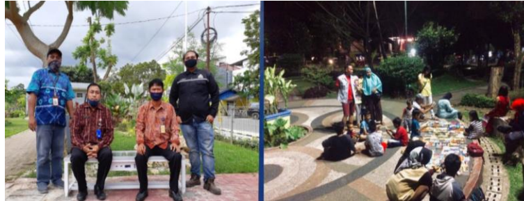
Gambar 4. Kegiatan Penyuluhan Kepada Pengelola Taman Mitra dan Penyuluhan Dengan Metode Penjelasan Pemakaian Alat Produk Smart Bench Oleh Anggota Tim

karena itu, pihak pengelola taman dinas terkait melalui kebijakan-kebijakan saja rasanya belum cukup tanpa penanganan langsung secara teknis. Pada saat yang sama, tim pelaksana dan mitra dapat terus belajar tentang informasi pembangkit listrik tenaga surya melalui berbagai konsultasi atau aplikasi. Di sisi lain, jika pemerintah mau serius menangani masalah ini, biaya tinggi tidak akan menjadi kendala besar.