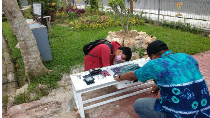
Gambar 2. Pemasangan dan Instalasi Alat Produk di Lokasi Mitra

Tahap awal ini adalah penerapan alat produk Smart Bench di lokasi mitra. Tim Dosen pelaksana program telah berhasil mengimplementasikan teknologi dengan spesifikasi panel surya berkapasitas 60 Wp/h dan posisi panel surya dirancang tetap sesuai struktur objek bangku. Kapasitas baterai dibuat 12 Volt 18 Ah, sedangkan sistem charging menggunakan solar charge controller. Fitur Lampu yang digunakan adalah lampu LED strip 12 VDC dengan komponen pengendali lampu menggunakan mikrokontroler Arduino Uno.