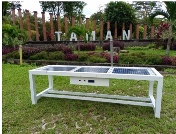
Gambar 3. Diseminasi Alat Produk Smart Bench di Taman Tiga Generasi

laboratorium konstruksi struktur objek bangku. Dosen Bapak Ezra Hartarto Pongtuluran, S.T., M.T berperan dalam merancang layout alat produk bangku serta membuat konstruksi bangku di bengkel. Dengan penggunaan panel surya yang terintegrasi dalam objek bangku, lokasi mitra Taman Tiga Generasi mendapatkan 1 fasilitas publik bangku multifungsi seperti pada Gambar 3 berikut.