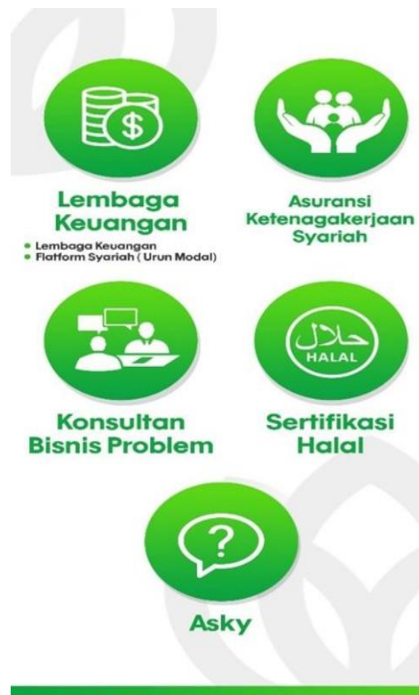
Gambar 1. Beranda SAS APP

Tahap pertama yang akan dilakukan ialah menentukan target konsumen. Konsumen pada aplikasi ini akan dibagi kedalam tiga target konsumen. Pertama , para milenial yang baru memulai merintis bisnis, Kedua , para UMKM dan Ketiga para entrepreneurs yang sudah lama bergelut dalam dunia bisnis. Kemudian dilanjutkan kepada tahap yang kedua, yakni identifikasi kebutuhan konsumen yang belum terpenuhi. Dalam tahap ini, dilakukan uji coba dengan memposisikan diri sebagai konsumen. Munculnya ide aplikasi SAS ini merupakan hasil dari kebutuhan konsumen, yakni masih belum terpenuhi dan berdasarkan hipotesis terhadap kebutuhan konsumen ialah perlu adanya One Stop App untuk para UMKM dan entrepreneurs dalam menyediakan informasi yang lengkap terkait bisnis. Secara umum yang menjadi perbedaan adalah belum adanya aplikasi konsultan bisnis yang berbasis aplikasi serta belum adanya penyediaan informasi secara real time dan lebih spesifik. Model Khusus UMKM dan Entrepreneur dalam aplikasi ini seperti pada Gambar 2 berikut.