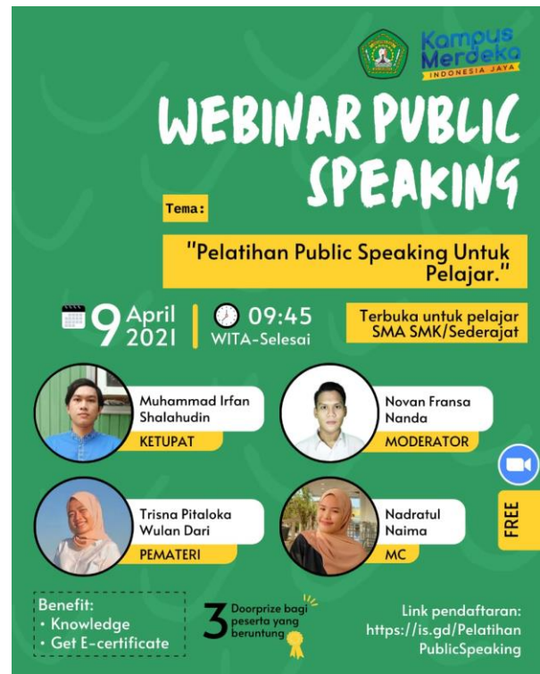
Gambar 1. Pamflet