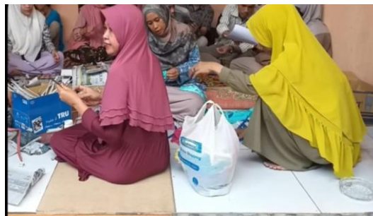
Gambar 2. Praktek Membuat Kerajinan Tangan

Gambar 2 menunjukkan transfer ilmu pengetahuan mengenai pentingnya mengelola limbah anorganik seperti kertas koran bekas demi menjaga kebersihan dan kesehatan lingkungan. Pelatihan kepada ibu-ibu rumah tangga juga dilakukan dengan menunjukkan dan sekaligus dilakukan praktek bagaimana membuat berbagai kreasi kerajinan tangan dengan daur ulang kertas koran bekas menjadi nampan, pot bunga, tempat tissue. Ibu-ibu rumah tangga sangat antusias dalam mengikuti pelatihan yang diberikan karena selama ini mereka tidak mengetahui jika kertas koran bekas dapat di daur ulang sehingga memiliki nilai tambah, bahkan dapat menghasilkan pendapatan bagi ibu-ibu rumah tangga.