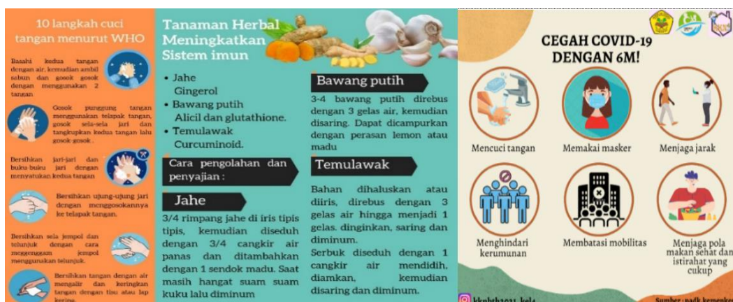
Gambar 3. Poster Pencegahan COVID-19

Sebagian besar Jemaah pengajian di Desa Panyairan belum menerapkan pencegahan COVID-19 dengan 6M. Masih banyak masyarakat yang belum mengetahui cara memakai masker yang baik dan benar. Sehingga dilakukan pemberian informasi singkat mengenai pencegahan COVID-19 dengan 6M yaitu mencuci tangan, memakai masker, menjaga jarak, menghindari kerumunan, membatasi mobilitas, menjaga pola makan sehat dan istirahat yang cukup. Jemaah pengajian juga diberikan brosur mengenai cara mencuci tangan yang baik dan benar, serta mengenai tanaman herbal yang berfungsi sebagai imunomodulator, foto kegiatan penyuluhan dapat dilihat pada Gambar 4 berikut.