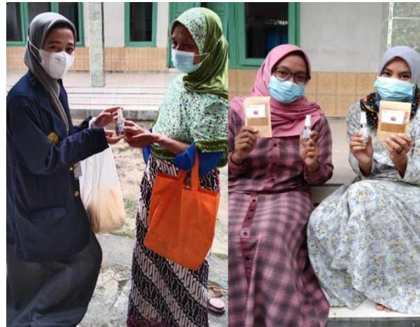
Gambar 5. Pembagian Produk Serbuk Instan Jahe Merah & Handsantizer

Pelaksanaan selama di lapangan sambil memperkenalkan diri sebagai mahasiswa STIKes Bakti Tunas Husada Tasikmalaya. Selama sosialisasi banyak hal positif yang kita dapatkan diantaranya masyarakat memperbaiki secara spontan pemakaian masker begitu kita berikan pemahaman, selain itu masyarakat juga mengetahui cara cuci tangan yang baik dan benar dengan menggunakan sabun cuci tangan atau handsantizer serta merubah jarak mereka pada saat kita memberi pemahaman.