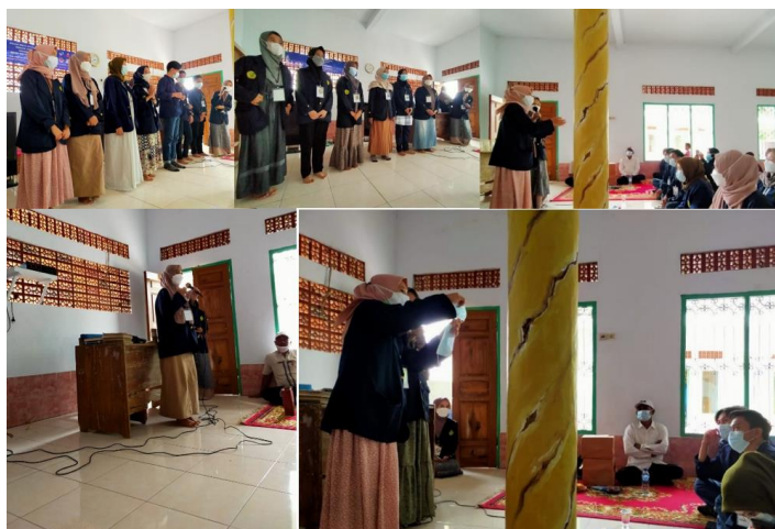
Gambar 4. Foto Kegiatan Penyuluhan

Sebagian besar Jemaah pengajian di Desa Panyairan belum menerapkan pencegahan COVID-19 dengan 6M. Masih banyak masyarakat yang belum mengetahui cara memakai masker yang baik dan benar. Sehingga dilakukan pemberian informasi singkat mengenai pencegahan COVID-19 dengan 6M yaitu mencuci tangan, memakai masker, menjaga jarak, menghindari kerumunan, membatasi mobilitas, menjaga pola makan sehat dan istirahat yang cukup. Jemaah pengajian juga diberikan brosur mengenai cara mencuci tangan yang baik dan benar, serta mengenai tanaman herbal yang berfungsi sebagai imunomodulator, foto kegiatan penyuluhan dapat dilihat pada Gambar 4 berikut.