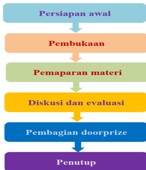
Gambar 2. Diagram alir kegiatan pengabdian masyarakat

Kegiatan pengabdian masyarakat yang dilangsungkan mulai dari persiapan hingga penutupan acara dapat dirangkum pada diagram alir sesuai pada Gambar 2 berikut.